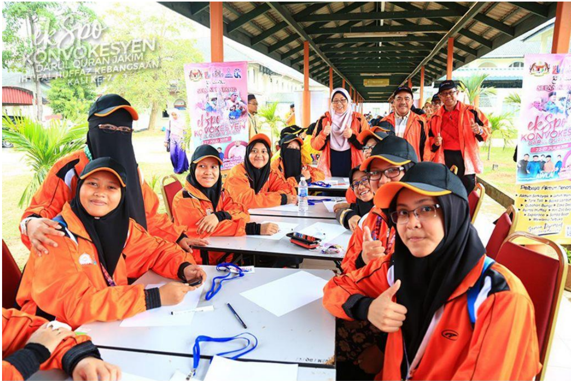
Suasana sebelum program Penulisan Al-Quran 30 Juzuk Darul Quran JAKIM bermula